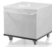
回収容器 30 l