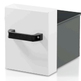
回収容器 10 l