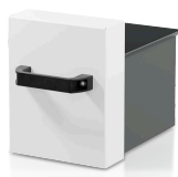
Colector 10 l