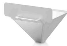
Accesoriu pentru operare în regim continuu